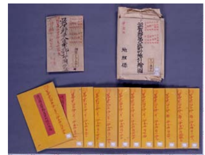
(滋賀郡第八区町町地引絵図)

下の図は、明治7年(1874)の「地引絵図」と言われるもので、明治初年の地租改正で発行された「地券」(=土地所有証券)の「取調総絵図」とも言います。