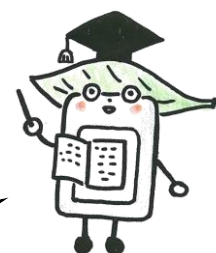
電子図書館キャラクター プレスちゃん